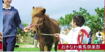
おきなわ乗馬倶楽部