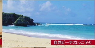
自然ビーチ(なっこうり)